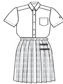
中学生・高校生共通